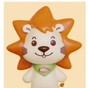
梁小狮 Lion Cub Liang